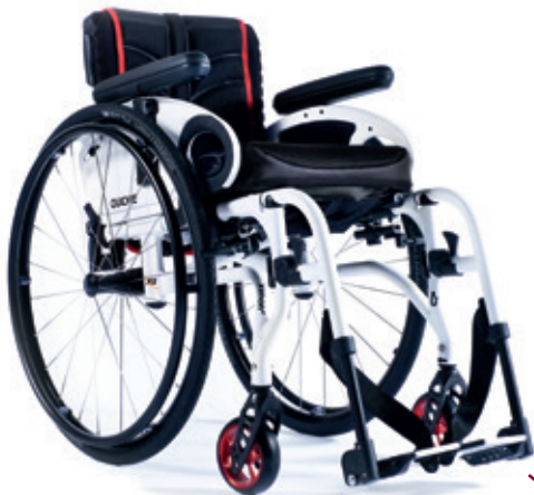
XENON 2 Reposapiés Desmontables LA MÁS VIAJERA