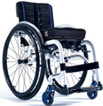
XENON 2 Armazón híbrido reforzado LA MÁS RESISTENTE