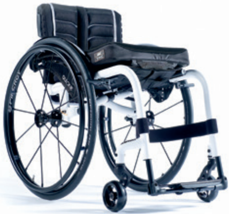
XENON 2 Reposapiés fijos LA MÁS LIGERA