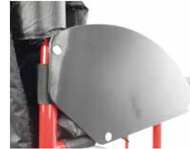
Protectores laterales de aluminio