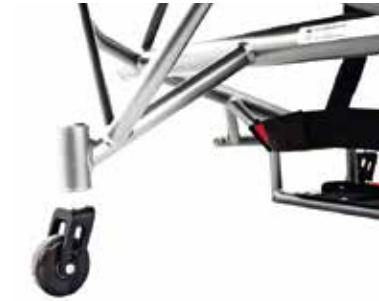
Antivuelco integrado con ajuste en altura (unidad o doble)