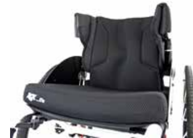
Soportes laterales ajustables integrados. Estabilidad lateral extra para garantizar el posicionamiento de columna en la línea media. Prevención de actitudes escolióticas y su progresión.