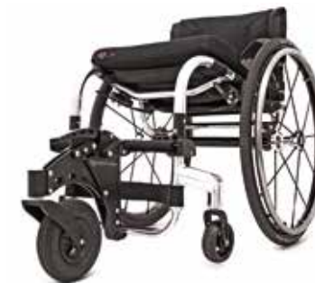
Rueda frontal todoterreno. Máxima libertad y facilidad de propulsión en todas las superficies. Compacta y muy fácil de instalar, incluso con el usuario en la silla. Compatible con Tiga, Tiga FX y Hi Lite.