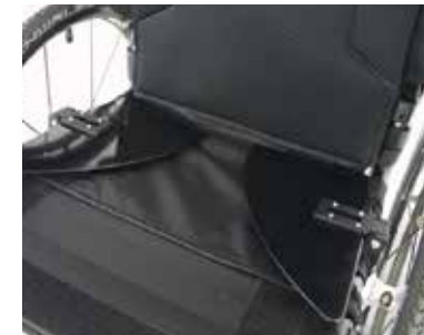
Protectores laterales plegables "Fold flat"