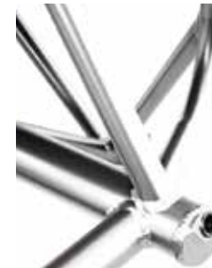
Tubo del eje integrado