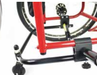
Centro de gravedad ajustable y antivuelco extraíble