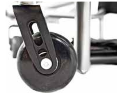
Horquilla de aluminio integrada, resistente y ligera