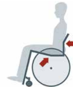
El diseño del asiento ergonómico con su sección en cuña y su sección horizontal optimiza la estabilidad pélvica, facilita la propulsión de la silla y minimiza la fricción para proteger la piel.