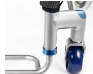
Detalles anodizados en color