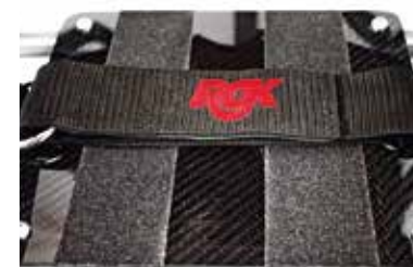
Reposapiés integrado con cincha pies