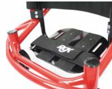
Reposapiés ajustable en altura y ángulo