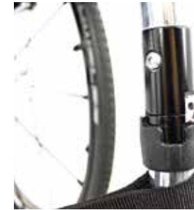
Sistema de plegado "Q lock" armazón frontal